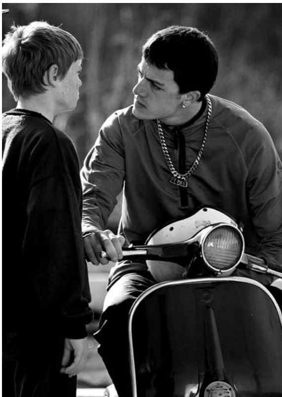
Foto tratta dal corto "Il Torneo" di Michele Alhaique, sul bullismo (vincitore del Nastro d'Argento 2008)

Per ulteriori informazioni: www.psicologiainsieme.it